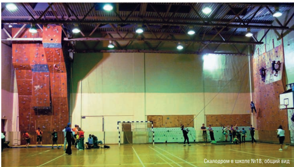
Скалодром в школе №18, общий вид