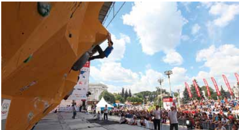
Кубок мира по скалолазанию (Москва, ВВЦ).

В современном скалолазании три основные дисциплины — трудность, скорость и боулдеринг. Названия трудности и скорости говорят сами за себя, а боулдеринг — это прохождение серии коротких и очень сложных трасс на небольшой высоте без альпинистской страховки (применяются гимнастическая страховка и маты). Исторически российская сборная занимает лидирующие позиции в скорости, в последние годы также занимает призовые места на важнейших международных соревнованиях в боулдеринге. А вот трудность — прерогатива европейцев. Здесь первенство принадлежит Франции, Австрии, Словакии, Чехии, Испании.